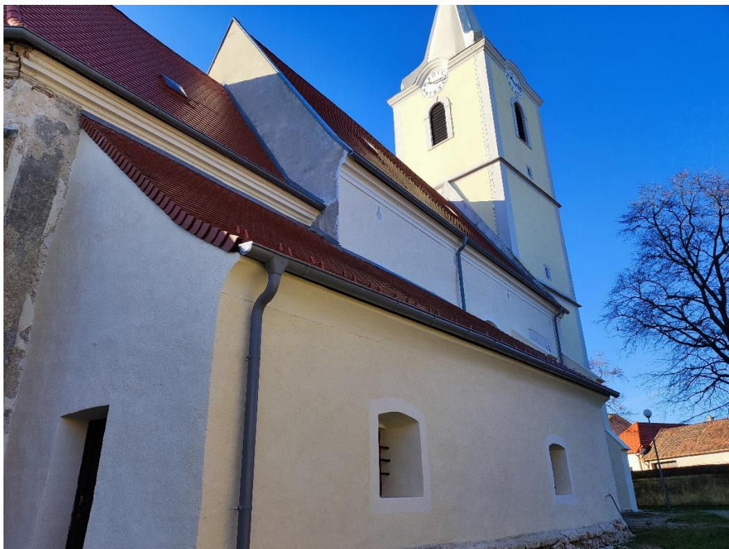
Pohľad na zreštaurovanú časť severnej fasády kostola Nanebovzatia Panny Márie v Dolných Orešanoch